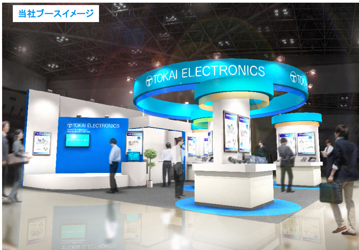
当社ブースイメージ