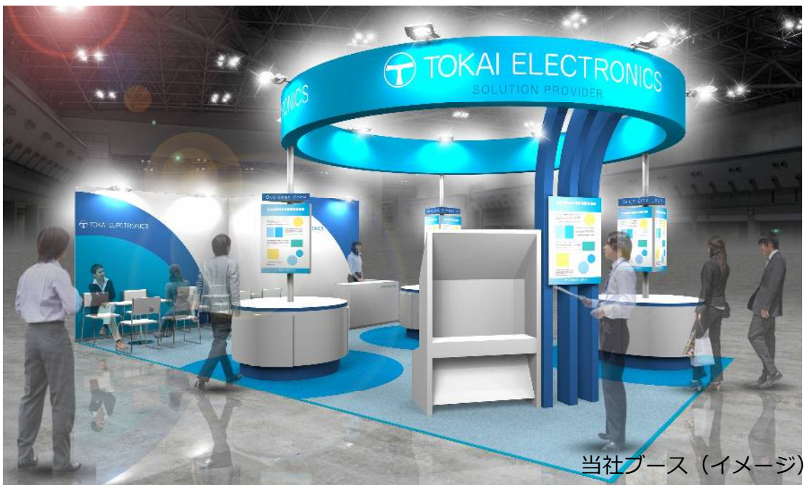
当社ブース (イメージ)