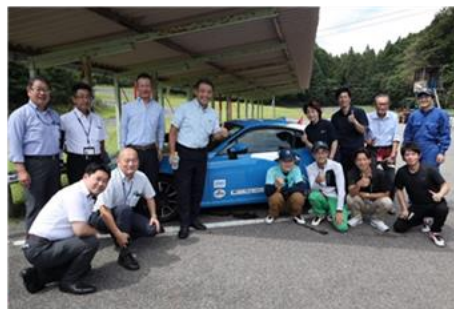
8/24練習走行及びリアルタイム 計測確認参加メンバー