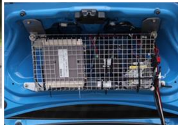
トランク上部設置 TTDC Smart Logging Service本体