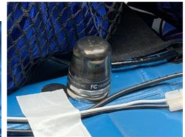
後輪車軸上部車内設置 無線式3軸加速度センサー（Parker社製）